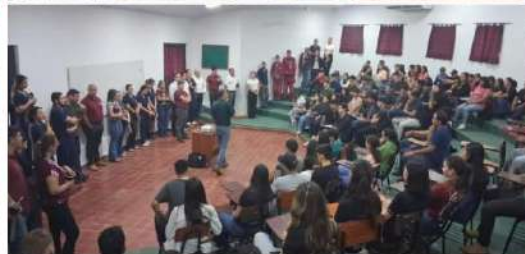
FCV UNA – FILIAL SAN JUAN BAUTISTA MISIONES