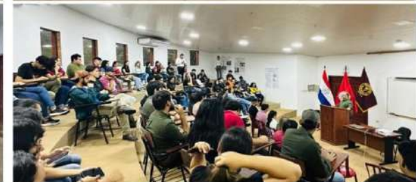
FCV UNA - FILIAL CAAZAPÁ