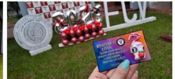
FCV UNA – FILIAL CONCEPCIÓN